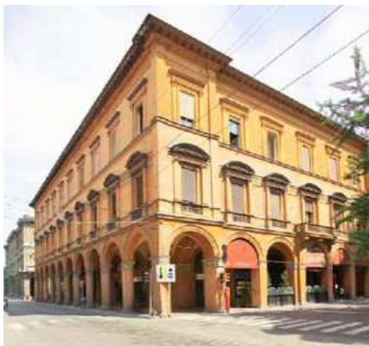
Bologna, Palazzo Guidotti