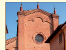
San Francesco (sec. XV) Famedio cittadino

Perfetto ed ornato esempio di teatro d'opera ottocentesco, con volta dipinta dal reggiano Giulio Ferrari (1858-1934). Salone dell'antico Palazzo di Nicolò da Correggio, Conte e poeta teatrale (1450-1508). Mostra un singolare fregio da torneo, affrescato (1490 c.)