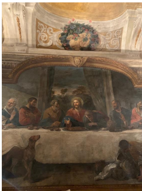
Pietro Fancelli, Ultima cena (1824)

La sede del Collegio Artistico Venturoli è un edificio storico di Bologna, opera di Giovanni Battista e Giuseppe Antonio Torri (1658-1713), arricchito da pitture murarie del periodo Illirico Ungarico ed in particolare dalla sala del Refettorio con gli affreschi di Gioacchino Pizzoli del 1700 e l' Ultima cena di Pietro Fancelli 1824. All'interno del Collegio si conservano varie collezioni e l'archivio storico del fondatore e architetto Angelo Venturoli, visitabili su appuntamento.