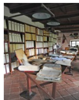
Il Castello di Pralormo e i suoi interni