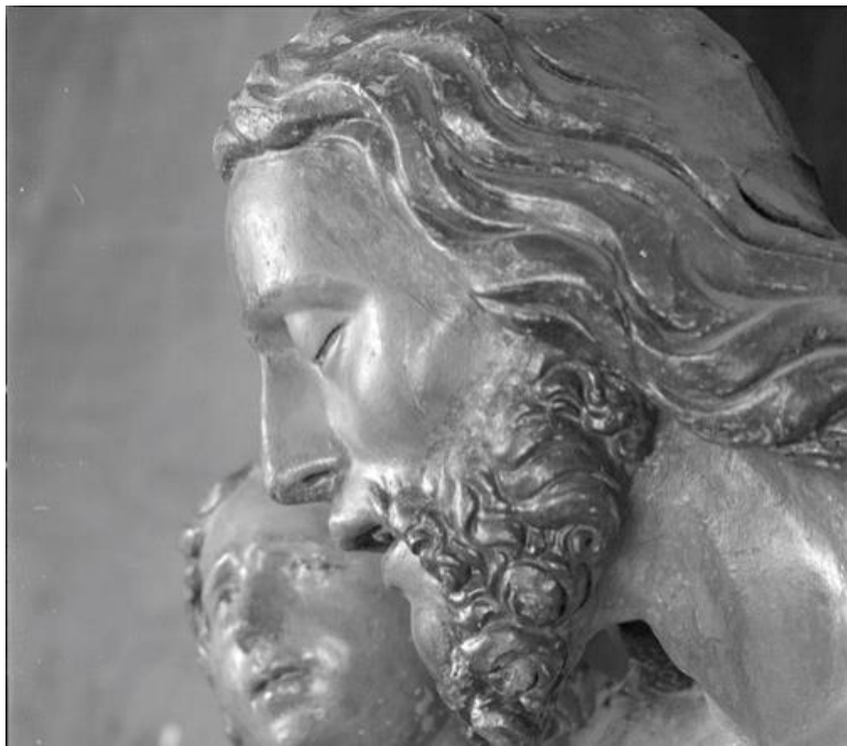
Codroipo-Duomo di Santa Maria Maggiore, Cristo in piet  sorretto da angeli (particolare) 2011