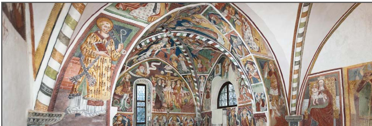
Abside della cappella