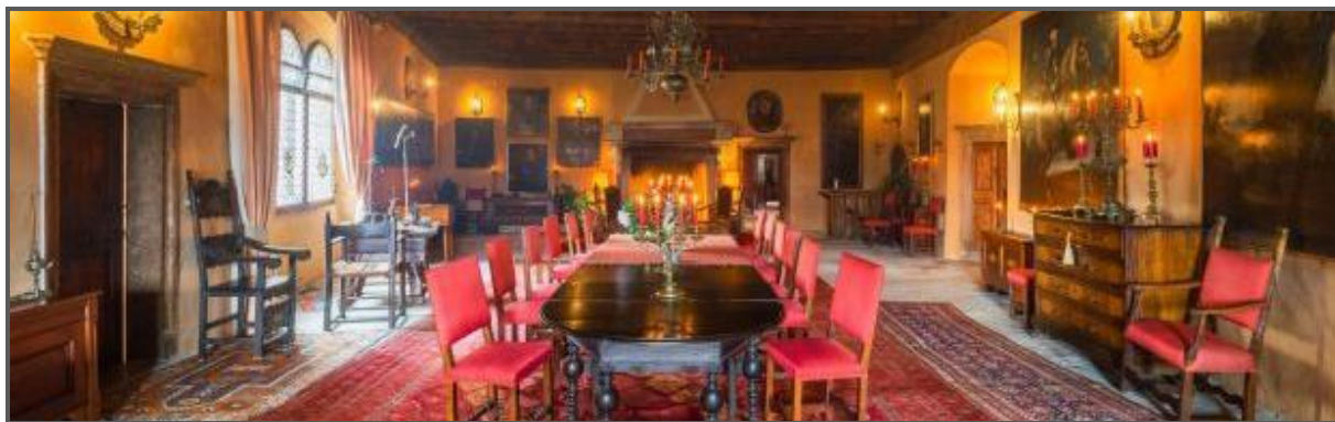
Castel Valer, Salone Ulrico

Associazione Dimore Storiche Italiane Sezione Trentino-Alto Adige / Südtirol