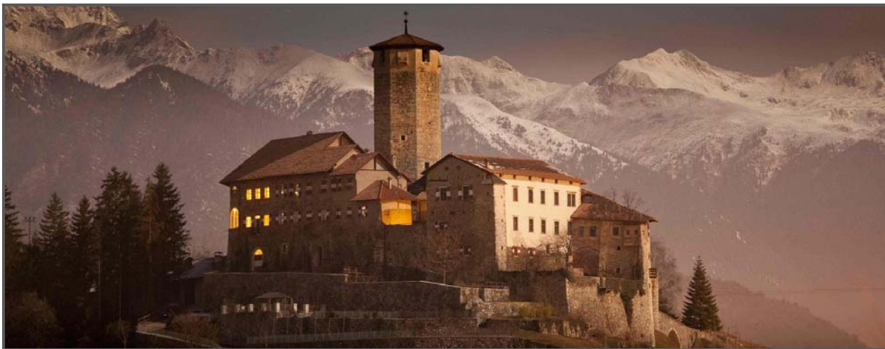
Esterno da sud-est