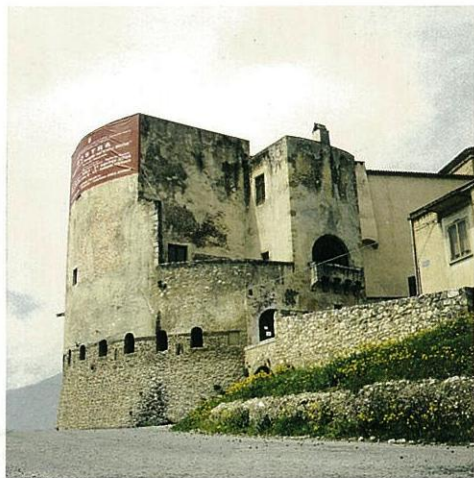
Castello Pandone, Venafro