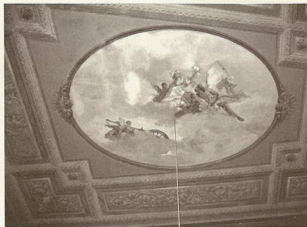
Saffitto del salone principale di Palazzo Malfatti Scherer ad Ala

Il palazzo Malfatti ora Scherer ad Ala è l'ultimo dei tre che la famiglia Malfatti costruì nel paese dopo aver venduto nel 1764 alla famiglia Angeli e nel 1804 alla famiglia Engelberg il palazzo di piazzetta ora Cantore. A metà Ottocento esso fu ampliato sul retro con un nuovo corpo ad uso di filanda e ridotto invece sul davanti per la necessità di ridirizzare via Nuova i cui edifici avevano un andamento irregolare che ostacolava il traffico. Dopo la fine della prima guerra mondiale la famiglia Malfatti abbandonò il palazzo che attraverso diversi passaggi di proprietà con la dispersione delle raccolte d'arte che lo arricchivano. Recentemente il professor Robert Scherer, noto pittore, lo ha acquistato, restaurato e restituito alla vita ed alla cultura.