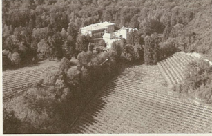
Villa Margon tra boschi e vigneti.